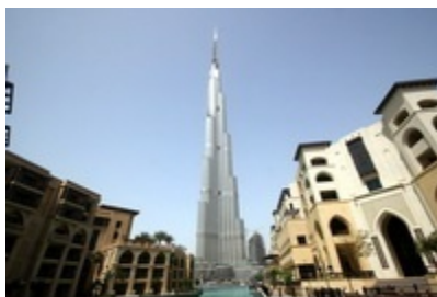
Dubai – Burj Dubai