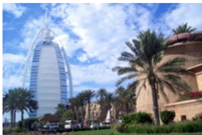
Dubai – Burj Al Arab