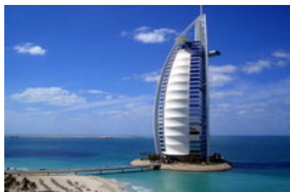
Dubai – Burj Al Arab

Cazare Dubai la hotelul ales, in tipul de camera specificat.