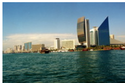
Dubai – Golful Persic