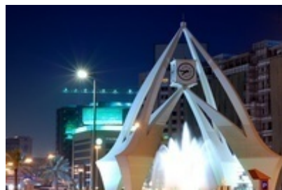
Dubai – Turnul cu ceas