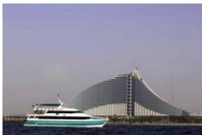
Dubai – Plaja Jumeira